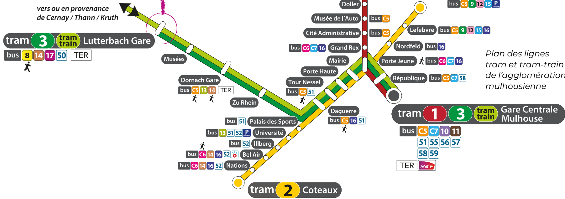
Plan des lignes tram et tram-train de l'agglomération mulhousienne